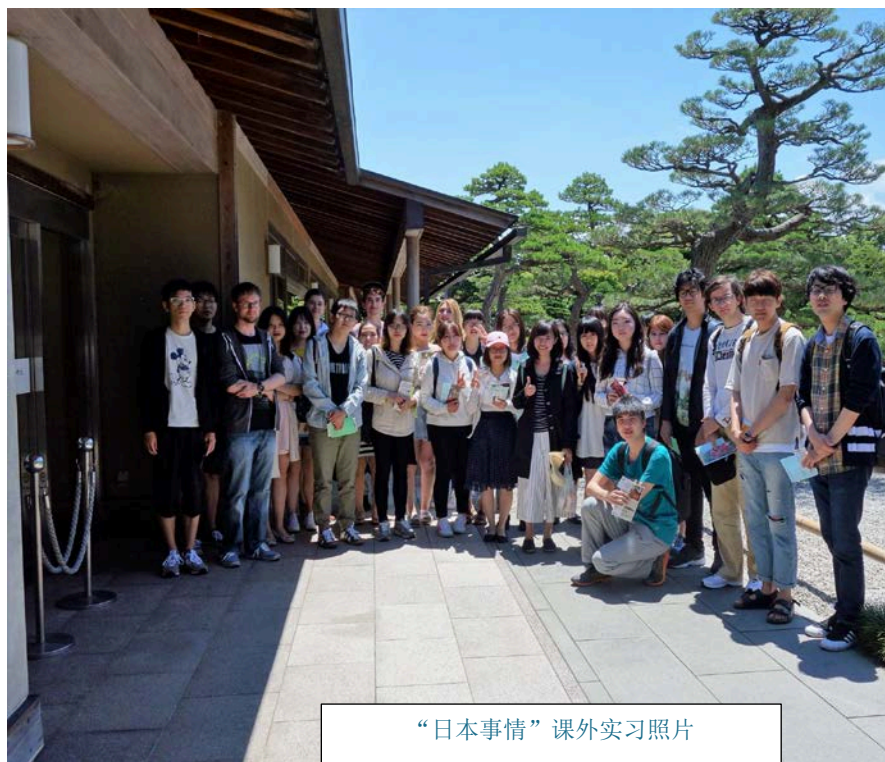
“日本事情” 课外实习照片